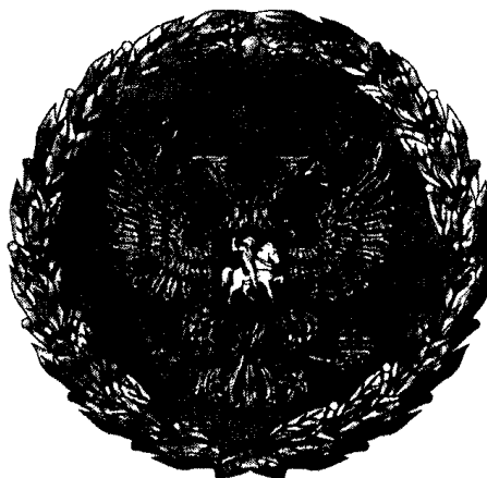
РИСУНОК НАГРУДНОГО ЗНАКА К ПОЧЕТНОЙ ГРАМОТЕ ПРЕЗИДЕНТА РОССИЙСКОЙ ФЕДЕРАЦИИ

Утвержден Указом Президента Российской Федерации от 11 апреля 2008 г. N 487